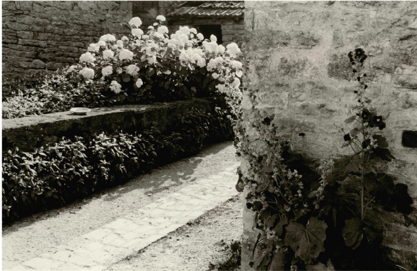
Côte d'Or, juillet 2003