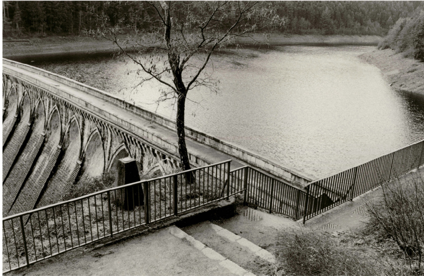
Loire, février 2007