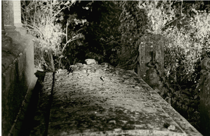
Saône et Loire, juillet 2005